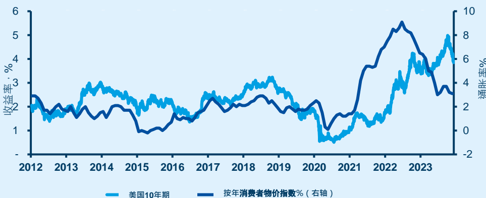
收益率从峰值回落，但降低政策利率和经济减速有利债券