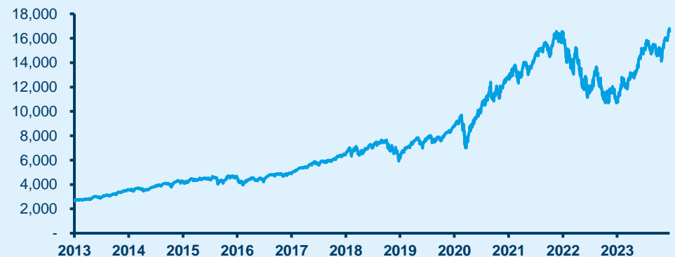
处于历史高位的纳斯达克100指数

“市场预期经济会出现“完美”的状态，但我们认为会出现评级下降的风险，并偏好盈利稳定的股票。”